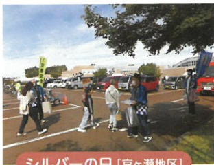
シルバーの日 [京ヶ瀬地区]