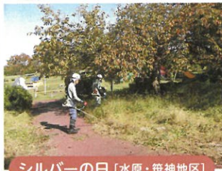
シルバーの日 [水原・笹神地区]