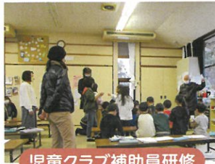
児童クラブ補助員研修