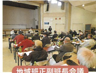
地域班正副班長会議