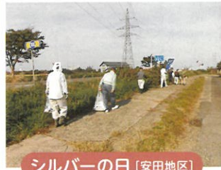
シルバーの日 [安田地区]