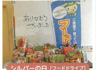
シルバーの日 [フードドライブ]