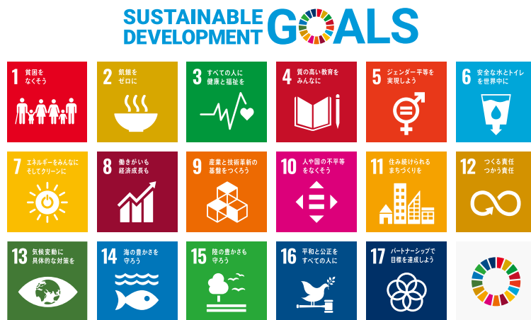
「SDGs:エスディージーズ 持続可能な開発目標」

これは、2015年9月の国連サミットで採択された、2030年までに持続可能でよりよい世界を目指す国際目標です。17のゴール(目標)と169のターゲット(具体的な取り組み)で構成され「地球上の誰一人取り残さない(leave no one behind)」ことを誓っています。(外務省資料参照)それでは何を持続していけばいいのかといいますと、その対象範囲は、地球上の社会・環境全般ということになります。その17の目標は、下の図のとおりです。