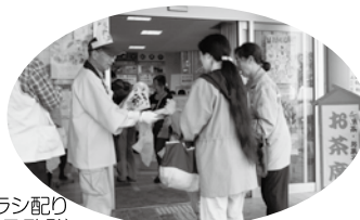
▲チラシ配り(普及啓発)