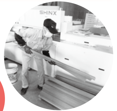
シルバー派遣事業

会員の方々はお互い助け合いながら、いろいろな仕事に従事しています。 役員は会員等の中から選ばれ、自主的な運営を行っています。