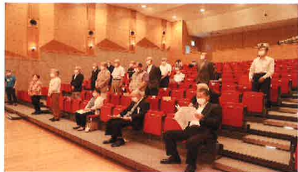
定時総会 会場風景

令和4年6月23日(木)阿見町本郷ふれあいセンターにおいて定時総会が開催されました。今年度も新型コロナウイルス感染拡大防止のため、参加人数を極力縮減して開催しました。会員の皆様には多大なるご協力を賜り感謝申し上げます。