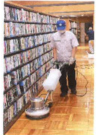
（ポリッシャー作業）