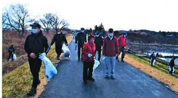
霞ヶ浦湖畔の清掃

○令和5年2月15日(水)「中央地区緑地」の剪定作業を行いました。21名の会員が参加しました。 ○令和5年3月5日(日)阿見町主催の「霞ヶ浦清掃大作戦」による霞ヶ浦湖畔の清掃を行いました。町民合わせて300名、センターからは、22名の会員が参加しました。 町長より、御礼のメッセージをいただきました。