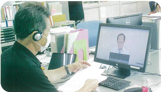
•新型コロナ感染防止対策のため、各種会議、研修会、 教育訓練はオンラインで行われています。