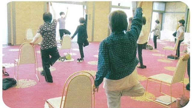
•10/14美祿グランドホテルで「椅子ヨガセミナー」。 •9/2, 3, 4、「保育サポート講習会」。 •11/27「整理収納セミナー」が開催され多数の参加 がありました。