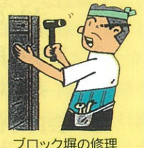
ブロック塀の修理 タイルの張替補修