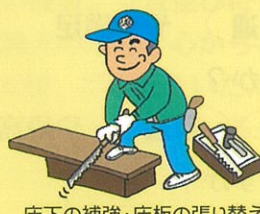
床下の補強・床板の張り替え トタン屋根・壁の張替