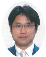
美祢市長 西 岡 晃