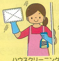
ハウスクリーニング 家屋内清掃