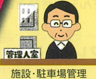
施設・駐車場管理

お気軽にご相談ください！ お仕事のお申し込みは電話でどうぞ。見積も無償でさせていただきます。