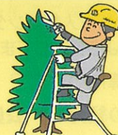
植木の剪定・消毒