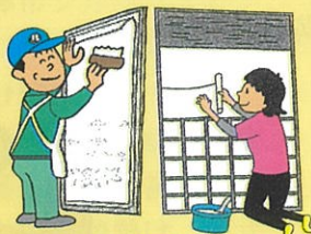
障子・襖・網戸の張り替え