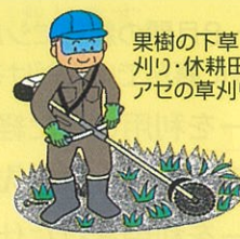
果樹の下草刈り・休耕田・アゼの草刈り