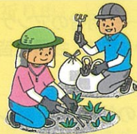
庭・花壇の草取り清掃