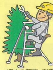
植木の剪定・消毒