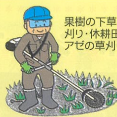
果樹の下草刈り・休耕田・アゼの草刈り