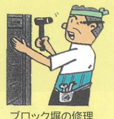
ブロック塀の修理 タイルの張替補修