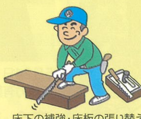
床下の補強・床板の張り替え トタン屋根・壁の張替