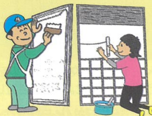
障子・襖・網戸の張り替え