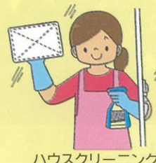
ハウスクリーニング 家屋内清掃