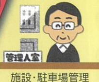
施設・駐車場管理