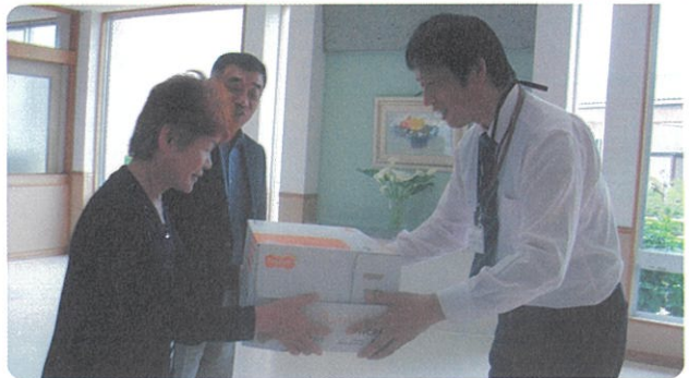
5月24日(水)、みとう悠々苑にタオルを贈呈しました。ご協力有難うございました。引き続き宜しくお願いします。