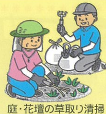
庭・花壇の草取り清掃