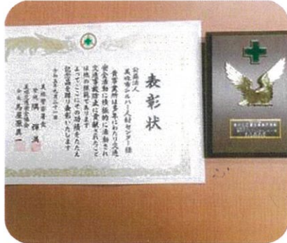
9月21日(木) 美祿警察署長、美祿交通安全協会より表彰され、美祿地区優良事業所として交通安全活動への貢献が認められました。