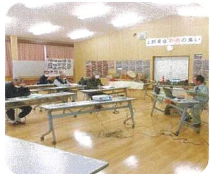
12月5日(火) 山口県シルバー人材センター連合会の主催で刈払機取扱について座学、実技を交えて学びました。