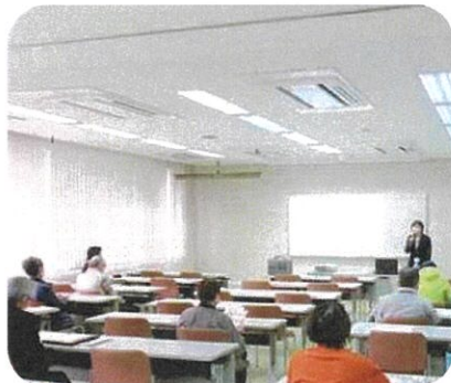
11月28日(火) サンワーク美祿で派遣労働者を対象に教育訓練を実施し、健康管理についての講習を受けました。