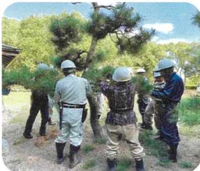
10月11日(水)、12日(木) 山口県シルバー人材センター連合会の主催で、2日間剪定講習会を実施しました。明日からでも実践できる内容で有意義な2日間でした。