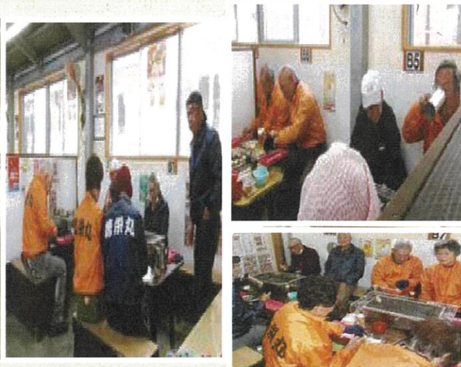
11月14日(火) 4年ぶりに親睦旅行を実施しました。福岡県糸島方面へ行き、会員同士交流を深めることができました。

この度は、親睦旅行に適した場所を計画し実行していただいたことにつきまして御礼申し上げます。旅行に参加できたのは毎日健康で生活しているからです。 11月14日は関門橋開通の日でもあり、今年に記念すべき50年目という節目に立ち会うことが出来ました。当日は天候も良く、有意義な時間を過ごすことができ思い出に残る一日でした。 来年も素敵な親睦旅行を楽しみにしております。ありがとうございました。