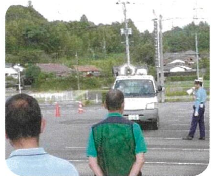
9月29日(金) 運転業務をされている派遣労働者を対象に教育訓練を実施し、美祿警察署より安全運転について、実技を含めながら講習を受けました。