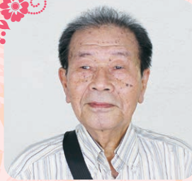
兼 証一会員 西尾久在住