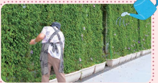
▲モミジヒルガオの緑のカーテン