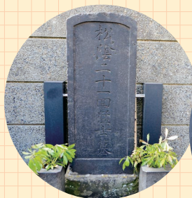
▲吉田松陰の墓 (現在は世田谷に改葬されている)

南千住駅西口に、コツ通りという商店街があります。幕末期から維新时期にかけて小塚原の刑場にまつわる歴史的スポットが点在。