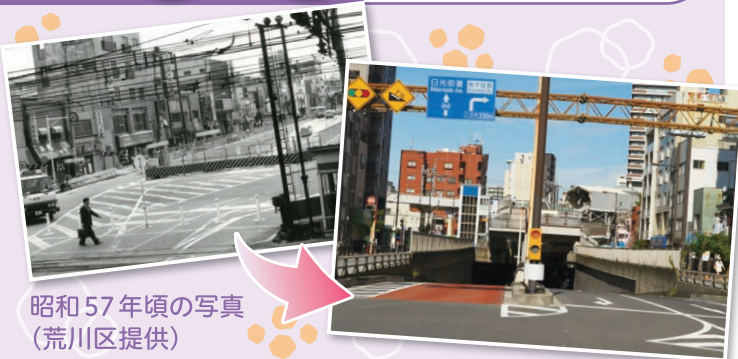
昭和57年頃の写真

この名称も過去形になりました。昭和57年までは南千住2・3丁目から駅方面へは隅田川貨物駅構内の踏切を通らなければならず、時間帯によっては貨車の入れ替え作業等で長時間遮断機が開かず車両も通行人も不便を感じておりました。昭和57年にアンダーパスが開通、その後エレベーター付きの歩道橋も完成して長い間の不便もやっと解消しました。S