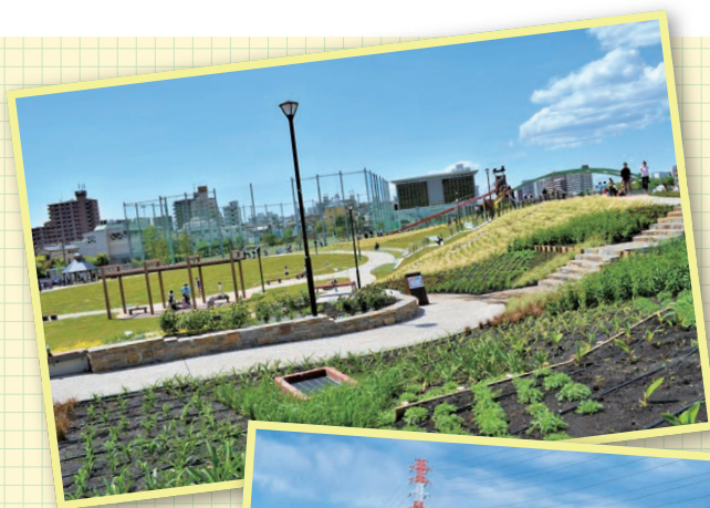
▲ ガーデンエリアと広場エリア

尾久消防署裏の送電線の下、長期間空地となっていた場所に広大な宮前公園が出来ようとしています。尾久図書館にはテラス席で読書ができるスペースがあります。「広場エリア」にはカラフルな遊具が設置され子供達が楽しそうに遊んでおり、続いて保育園もあります。また隅田川のスーパー堤防周辺の施設が着々と出来上がってきており、休日には大勢の家族連れで賑わっています。今後ガーデニング広場やテニスコートが出来上がると幅広い世代の人々が集い安心安全な公園として賑わうことと思います。(池)