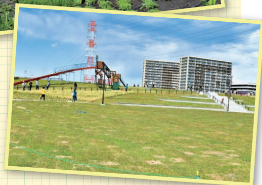
▶ 広場エリアの広～い芝生の絨毯