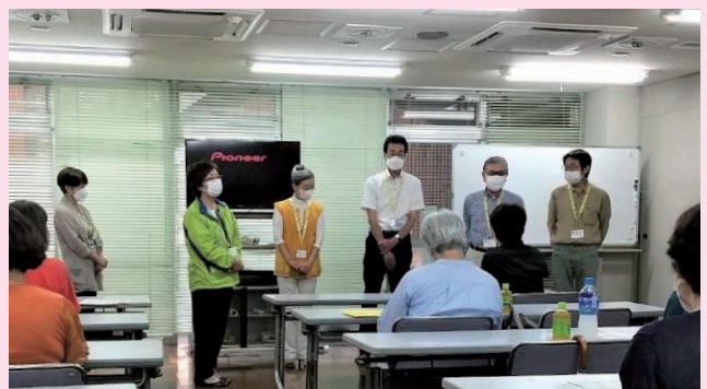
写真②：就業機会創出員の紹介▲