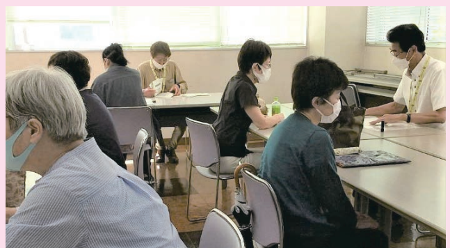
写真③：ヒアリングの様子▲