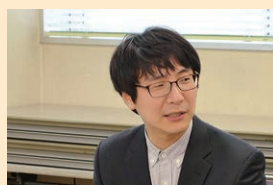
▲通訳をされたファンさん

韓国で進む少子高齢化に備え、仁川広域市西区公務員研修団10名が当センターの活動状況を視察するために訪問されました。