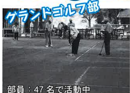
グランドゴルフ部

シルバー会員相互の親睦を図る意味からも、同好会活動は不可欠です。いろいろな企画のもとで各サークルが積極的に活動して会員相互の親睦を図るようお願いします。