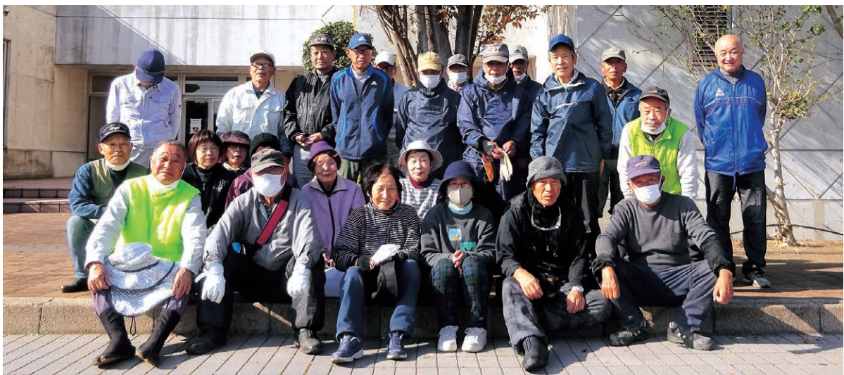
岩屋・東浦会員 サンシャインホール