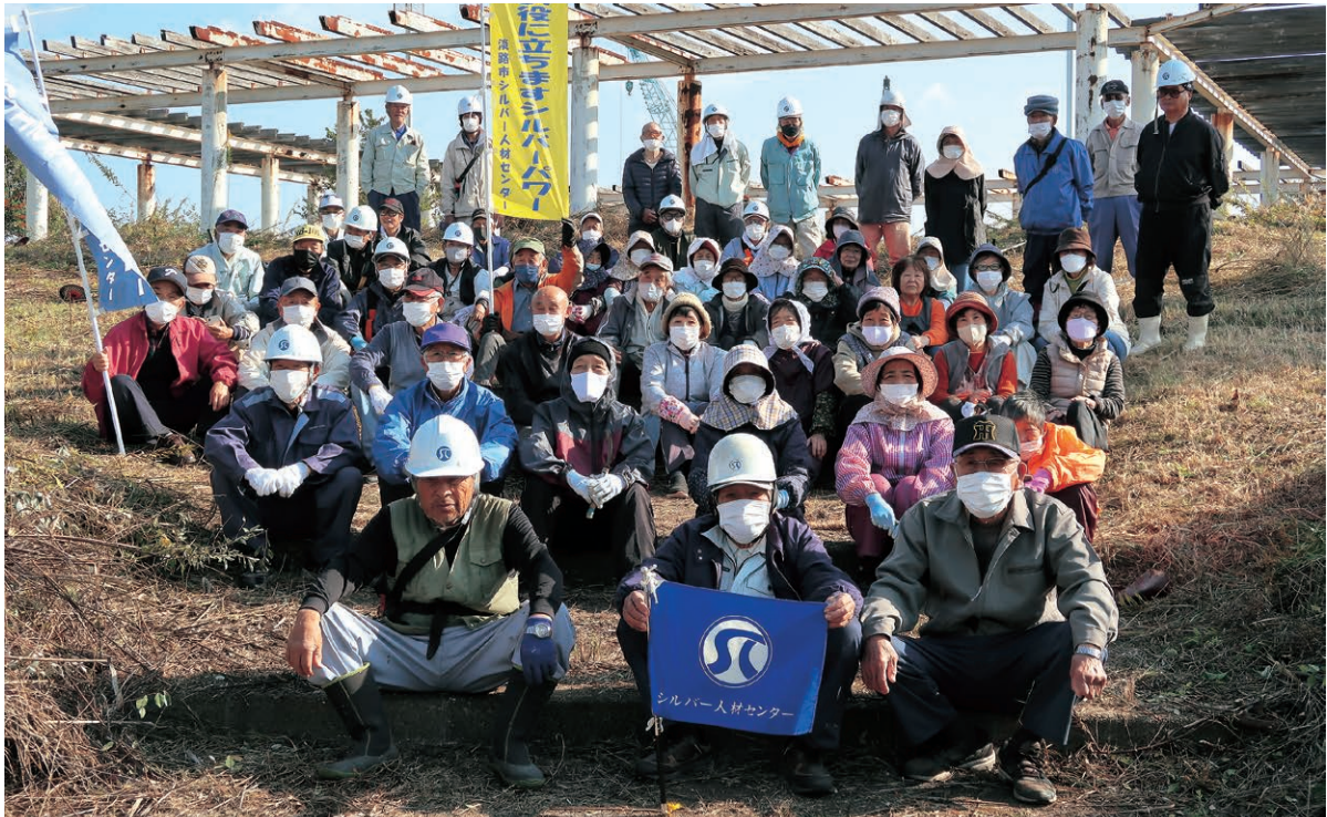
津名・一宮・北淡会員 津名港ターミナル