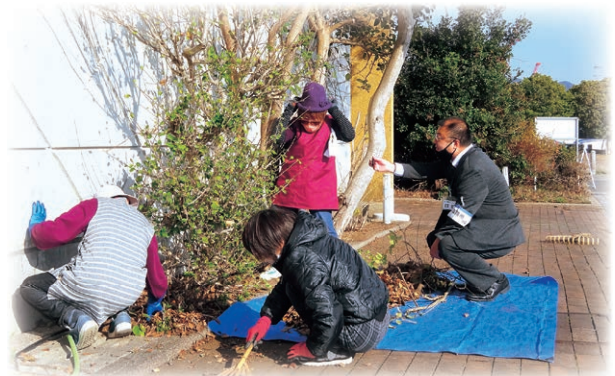
津名・一宮・北淡会員 津名港ターミナル