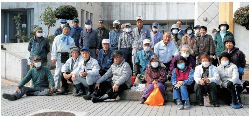
岩屋・東浦会員 サンシャインホール周辺で奉仕作業