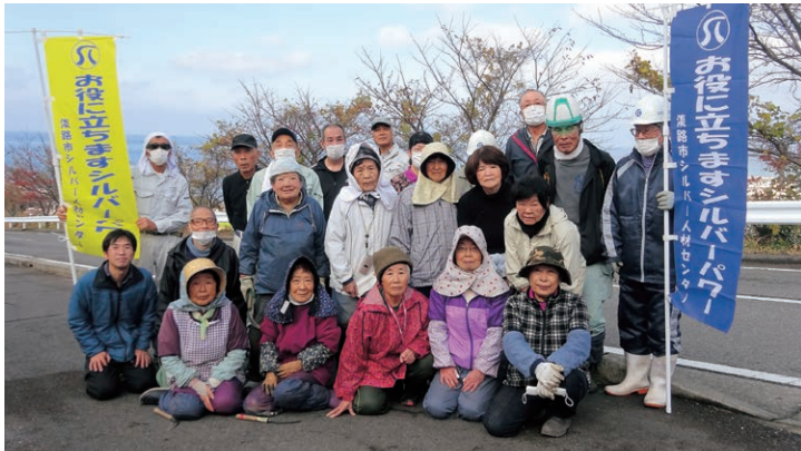
北淡会員 北淡中学校周辺で奉仕作業