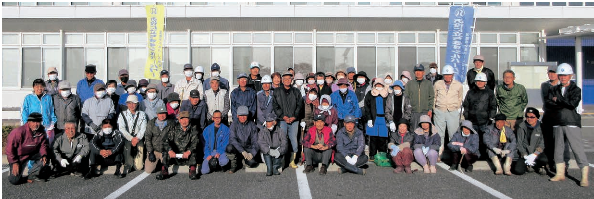
津名・一宮会員 淡路市役所周辺で奉仕作業

豊富な経験と知識を有した会員が、地域の皆様のご要望に沿った仕事をお引き受けします。