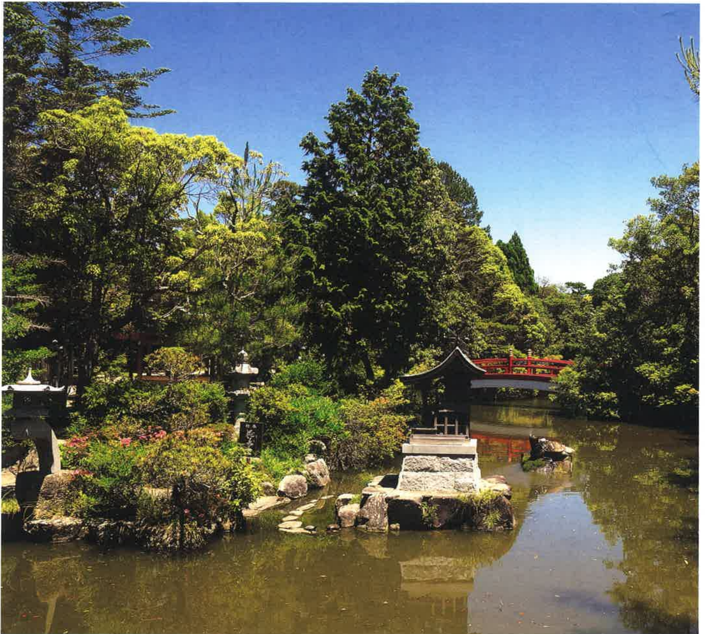
伊弉諾神宮にて 水神を臨む