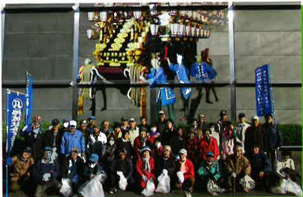
夜祭ゴミ拾いボランティア