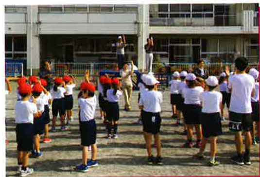
南小学校秩父音頭指導