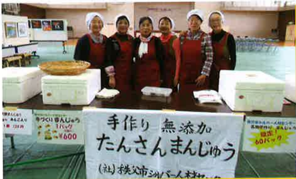
まんじゅう作り販売