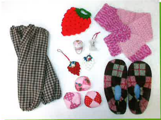
手づくり小物販売

このほか、ボランティアとして、毎年南小学校児童に運動会で発表する秩父音頭の指導や、12月4日に夜祭後のゴミ拾いなど、地域社会と連携する活動も行っていきます。