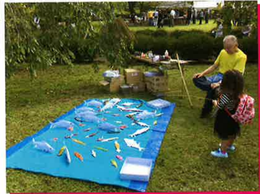
イベントでの折り紙魚釣り