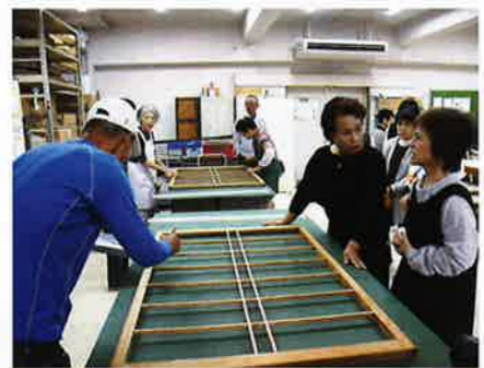
恵那市シルバー視察研修 11月24日 恵那市民生委員協議会 高齢福祉部会の皆さま 17名来場