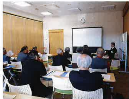
シルバー先進地視察研修 11月20日 加賀市、11月21日 小松市 理事・役員 17名、職員 4名 参加