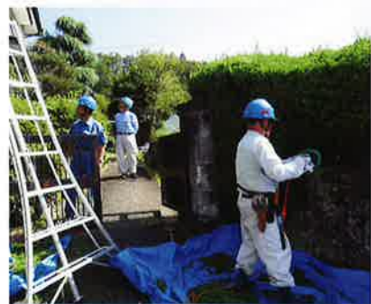
安全パトロール(安全就業委員) 9月26日 長島町・武並町