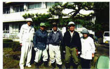
10月31日 飯地小学校 整枝剪定 5名参加