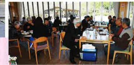
シニアを活用する企業との交流会 (岐阜県人チャレンジ主催) 9月12日 恵那文化センター 53名来場