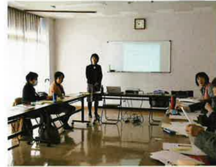
整理・収納アドバイザー2級講習会 12月11日 共同福祉会館 10名参加