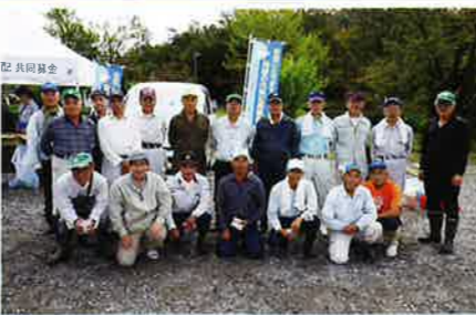
10月26日 恵那病院環境整備 21名参加 開催:17回 延べ200名参加