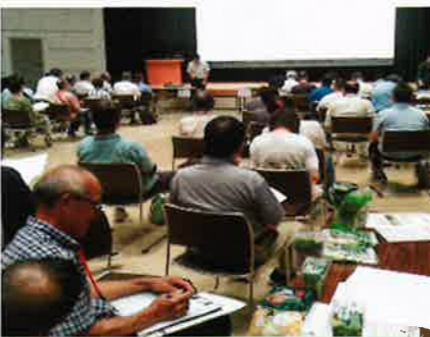
シニアを活用する企業との交流会 (岐阜県人チャレンジ主催) 9月12日 恵那文化センター 53名来場