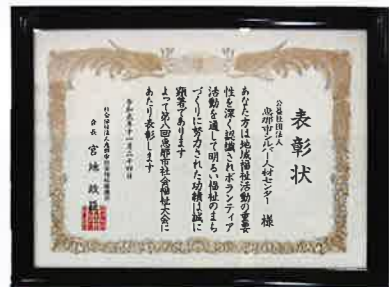
恵那市福祉大会 11月4日 表彰状を頂きました。 病院、こども園、学校、介護施設等の シルバー会員のボランティア活動 が認められました。