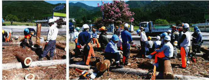
伐木チェーンソー作業従事者特別教育 9月18日 恵那建設会館、9月19日 加子母森林組合 延べ28名参加