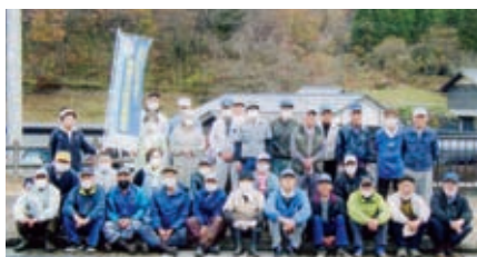
総合福祉センター・やすらぎ 11月22日(日) 明智班 32名