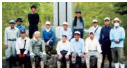
山岡中学校 6月18日 山岡班 14名