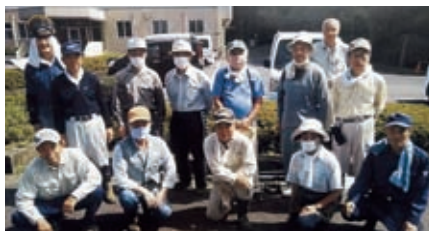
大井第二小学校 9月12日(土) 大井1・2班 13名