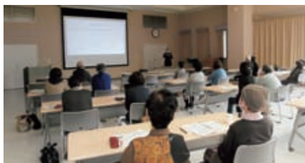
恵那市おしゃべりパートナー 回想法研修会 11月6日(金) 36名