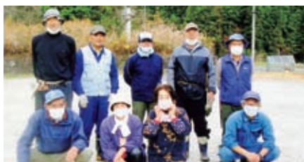
中学校・こども園・福寿園 11月22日(日) 上矢作班 17名