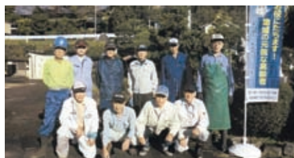
中野方小学校 10月11日(日) 中野方班 11名