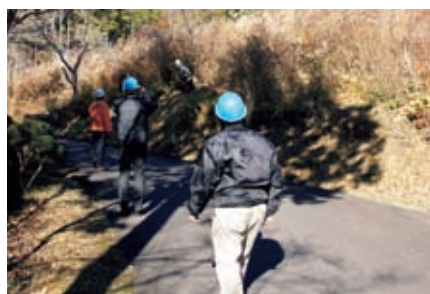
明智町 明智の森 草刈作業 10月5日(月)