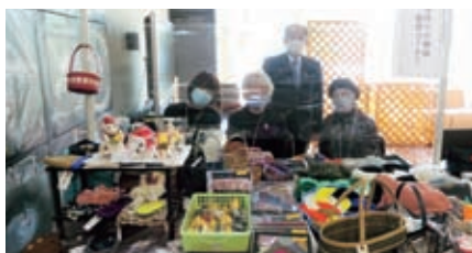
素敵な働き方セミナー 11月16日(月) 研修と手づくり品の販売 16名