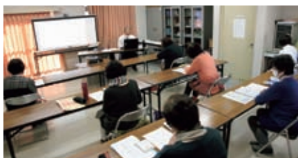
介護相談員研修会 11月30日(月) シルバー本部 7名