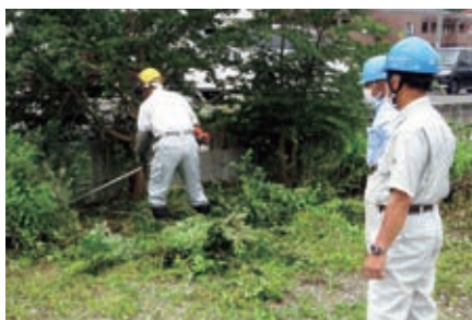
長島町 草刈・伐採作業 6月25日(木)