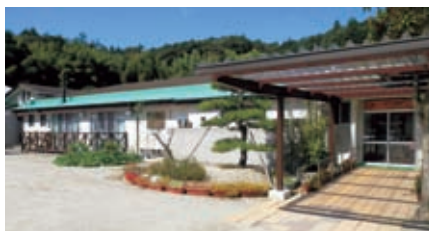
清掃作業体験講習会 11月18日(水) 藤の里[結い] 5名