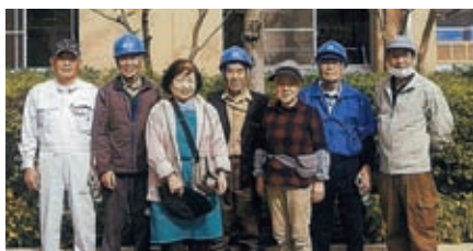
大井小学校 10月24日(土) 大井町3・4班 7名