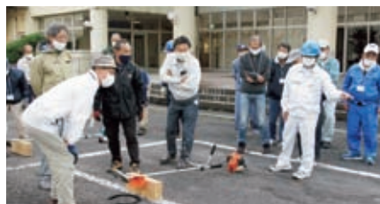
刈払機作業の講習会 11月19日(木) 農村環境改善センター 6名