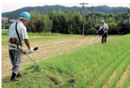
長島町 草刈作業 9月24日(木)