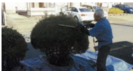
シルバー人材センター 10月19日(木) 原田金治様