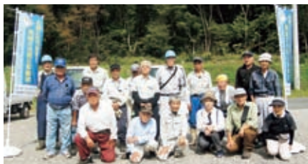
恵那病院 10月3日(土) 全地域 18名