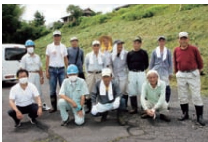
岩村町 草刈作業 7月22日(月)