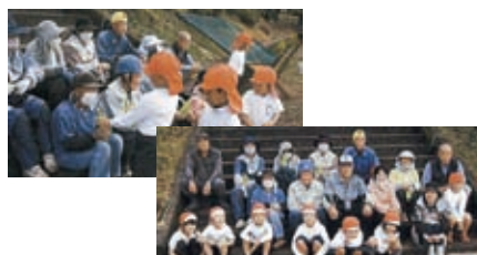
こども園 11月19日(木) 東野 1・2班 17名