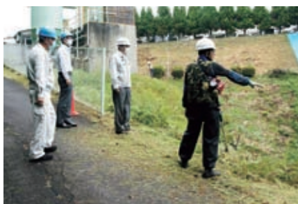
明智町 明智ガイシ 草刈作業 10月5日(月)