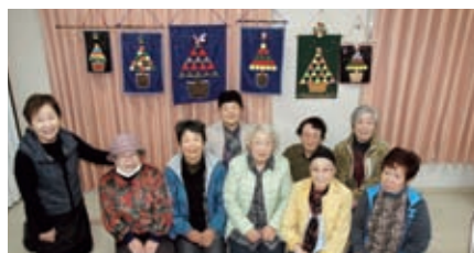
趣味の会 11月24日(火) クリスマスバスター作り 9名