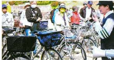
婦警さんの話聞き入る皆さん

3月15日(木)、茨木市役所前の南グラウンドにて開催されました。今回は会員をはじめ、広く市民にも呼びかけ、茨木警察・茨木市の協力で120人を超える参加者が自転車運転のルール・マナーを教わりました。