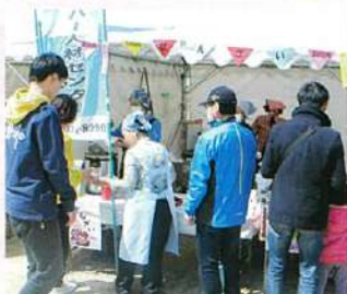
おいしいぜんざい 大盛況

今年のさくらまつりは、3会場に分かれて行われ、シルバー人材センターは、中央公園会場でぜんざいとジュース等の販売を行いました。会場は、お祭り気分満載のイベントでした。 私たちが「ぜんざいいかがですか!」と、呼びかけを行ない、たくさんのお客様との交流を図りながら、楽しい時間を過ごさせていただきました。(土肥 紀子)