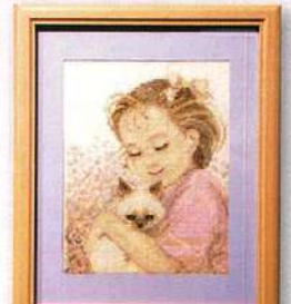
手芸：クロスステッチ

初めて、市立ギャラリーにて開催。多くの市民が来場され、「シルバーさん、なかなかやりまんあー」[来年も開催してほしいです!]との多くの声をいただき、連日、大好評でした。