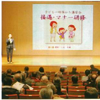
接遇マナーのもよう

人材育成の経験豊富な講師を迎えての「接遇・マナー研修会」に参加しました。ゲーム感覚で楽しく学び、大変役に立つ研修でした。