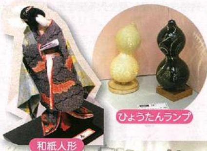
ひょうたんランプ