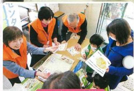
シルバーまつり受付

たたたきがふるまわれ、長蛇の列。あちこちで「おいしいね!」の声が飛び交いました。茨木市が誇る、ゆるキャラ軍団(着ぐるみ)と、防火を呼びかけるミニ消防車試乗も子どもたちに大人気でした。 約600人の参加者があり、行政、民間一体となつての運営で大いに盛り上がった1日でした。 (藪下 昌久・川野 正照)