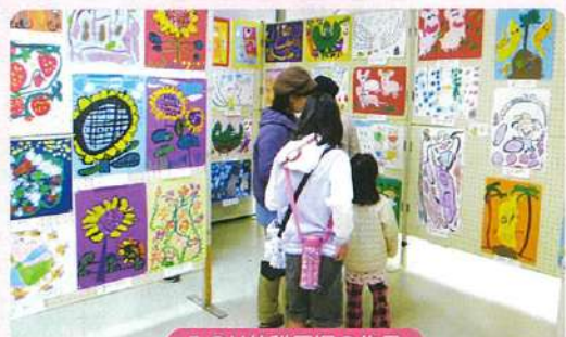
みのり幼稚園の作品