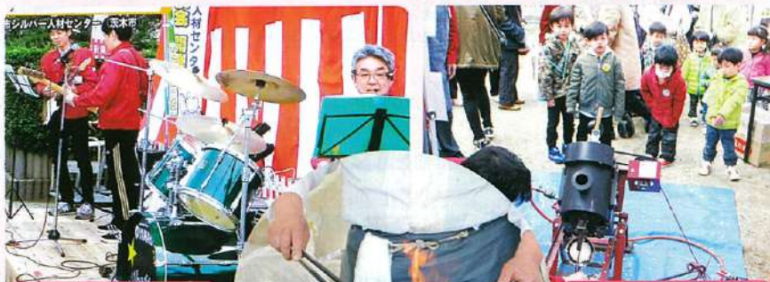
演奏する職員の皆さん

たたたきがふるまわれ、長蛇の列。あちこちで「おいしいね!」の声が飛び交いました。茨木市が誇る、ゆるキャラ軍団(着ぐるみ)と、防火を呼びかけるミニ消防車試乗も子どもたちに大人気でした。 約600人の参加者があり、行政、民間一体となつての運営で大いに盛り上がった1日でした。 (藪下 昌久・川野 正照)