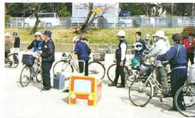
実技講習に取り組む参加者

「食事の提供を主とした世代交流で子どもの楽しい時間の提供と福祉の増進」をコンセプトに、福祉家推進委員会を中心に準備を進め、3月30日に当センター大会議室で試行開催しました。