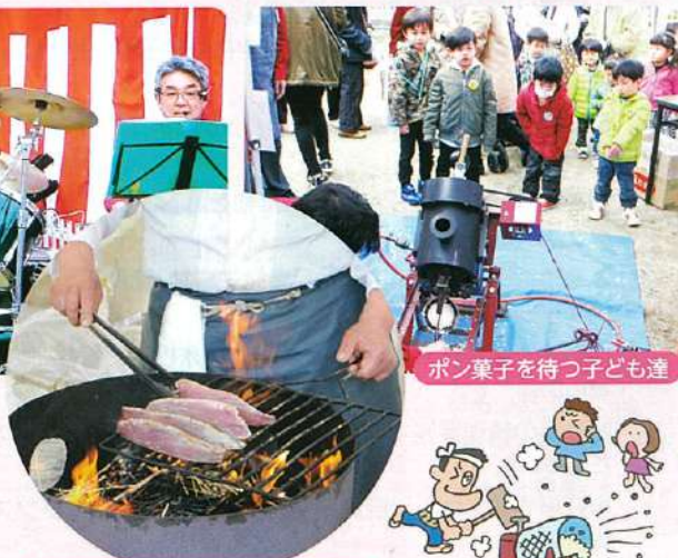
ポン菓子を待つ子ども達