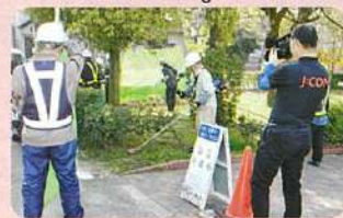
除草作業取材中のJCOM

シルバーの活動、市民の皆さんが見ています。——この春開催された行事が、JC O Mや読売新聞で相次ぎ取り上げられ、話題に。報道機関を活用しての普及啓発が奏功したものです。