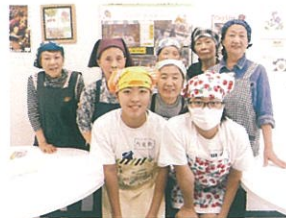
ショップの皆さんと