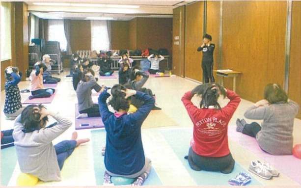
10歳若く！アンチエイジング

1回目は肩こり、腰痛を癒やす体操。タオル、椅子、マットを使ってのストレッチや筋トレ。