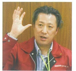
飯倉次長 …「シルバー発展のカギは普及啓発」

ってもらうことにより、センターとはどんな組織で、どんな活動ができるのかを多くの方に周知浸透させ、その結果、信頼・信用を獲得することです。こうした行動が、シルバーが掲げる会員拡大・就業拡大・社会貢献などの実践につながるのです。