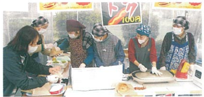
楽しく販売する会員

2月16日、あいにく、朝から小雨が降る中、桑田町のシニアプラザにてアクティブシニアフェスタが開催されました。私たちは自慢の柚子みそ味のオリジナル「ハンバーバー」とフランクフルト販売で参加しました。開店と同時に多数の人が買いに来られました。「前に来た時買えなかったから、今日は早く来たよ」とか、「おいしい