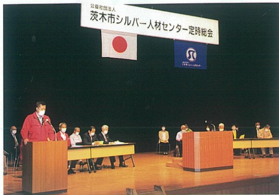
コロナ禍での定時総会

令和3年度の定時総会は、6月1日茨木市市民総合センターにおいて、昨年同様、新型コロナウイルスの感染防止対策のために書面による議決権の行使を認め、役員以外の方の会場への参加は極力控