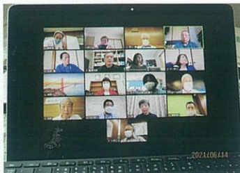
リモート会議練習中

推進役の宮野常務理事は「始まったばかりでまだ試行錯誤の段階。コロナ収束時には専門委員会への適用も」と語ります。(川野正照)