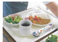
タコさんウインナーをトッピング

8月のメニューはカレーでした。おかわりする子どもたちで大忙し。今回のこども食堂利用者は過去最高の40人でした。