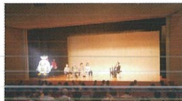
参加者の質問に体験談を披露

また、「何事も楽しむこと」がモットーとかで、今は、家族で富士登山を目指してトレーニングしている毎日。早起きして1時間ほど歩いているそうです。色紙には「挑戦」としたためられました。(後藤政市)