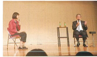
トークショーで盛り上がる！

直後のアンケートでは、トークショーの進行、センターの説明も分かりやすかったと好評で、33人(うち、女性11人)の入会希望があり、今後の、特に女性会員増強に弾みがつきました。