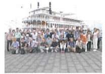
クルーズ船をバックに