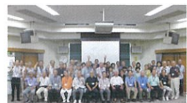
滋賀県レイカディア大学(草津)にて