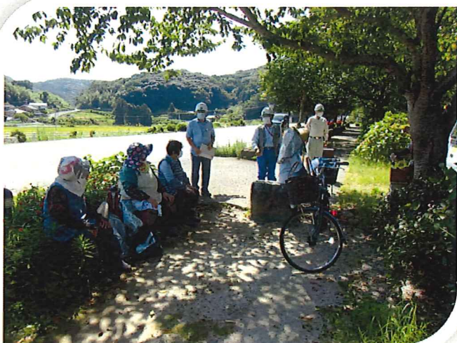
○森山地域の市道除草