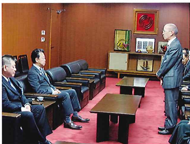
大久保市長への要請