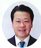
諫早市長 大久保 潔重