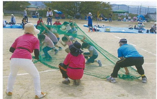
運動会障害物競走