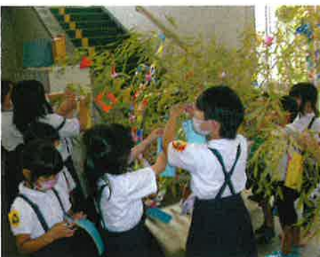
ホープ がみいわで