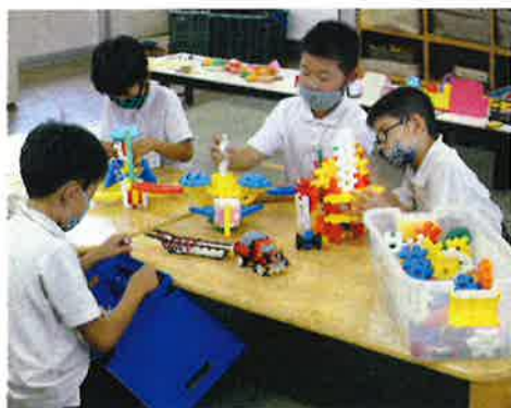
ホープ やまさき北

子ども達の元気なパワーを貰って、指導員も資質の向上、技術の習得、人格の高揚を目指し日々頑張っています。