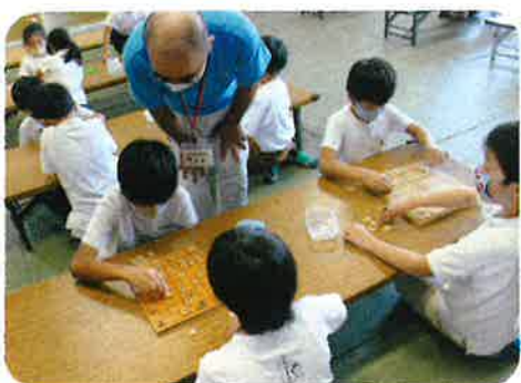
ホープ ちゅうおう