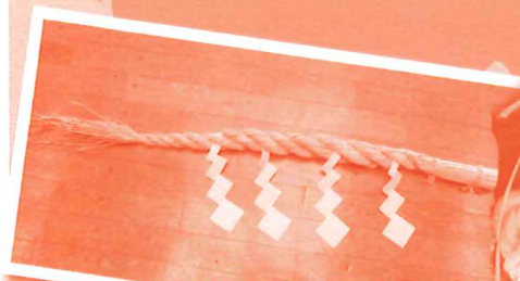
牛蒡飾り3尺連柱 1,300円