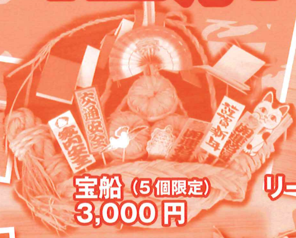
宝船 (5個限定) 3,000円