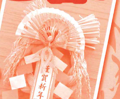
リース飾り (20個限定) 1,000円