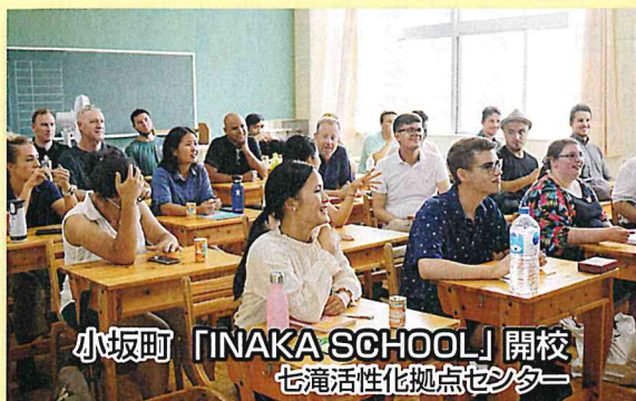
小坂町 「INAKA SCHOOL」開校 七滝活性化拠点センター