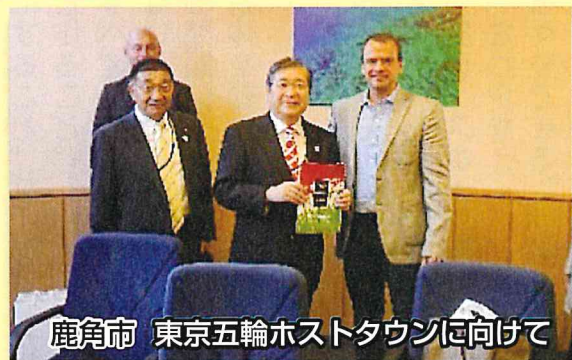
鹿角市 東京五輪ホストタウンに向けて