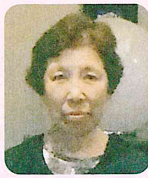
安 保 サ チ (十和田)