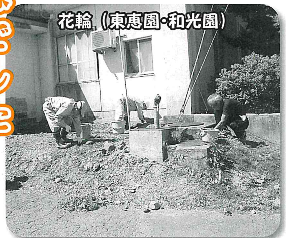
花輪 (東恵園・和光園)