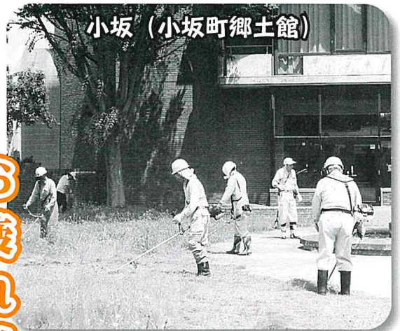
小坂 (小坂町郷土館)