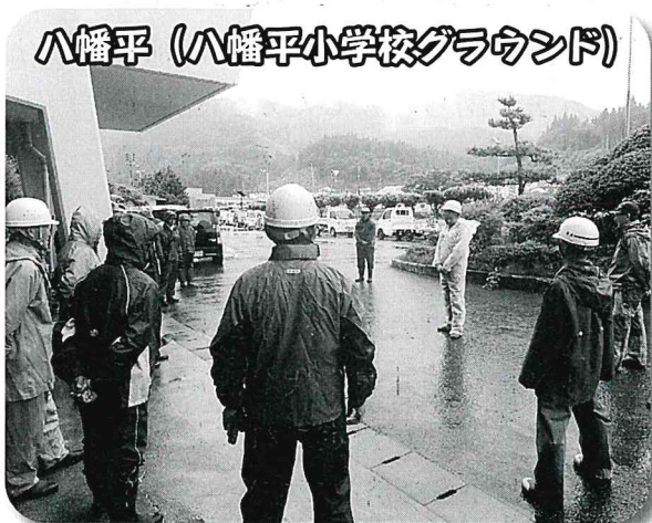
八幡平 (八幡平小学校グラウンド)