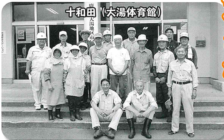
十和田 (大湯体育館)