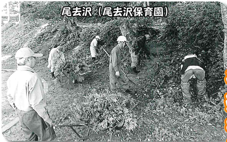
尾去沢 (尾去沢保育園)