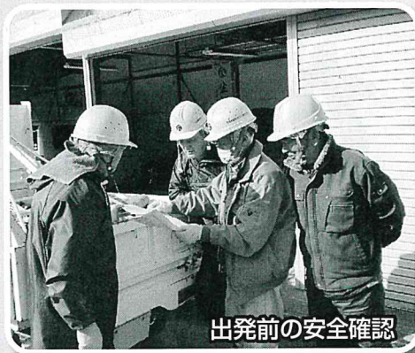
出発前の安全確認

今年度も、事故未然防止のため安全標語の募集・発表、安全適正就業委員と女性部会委員による現場パトロールを予定しています。