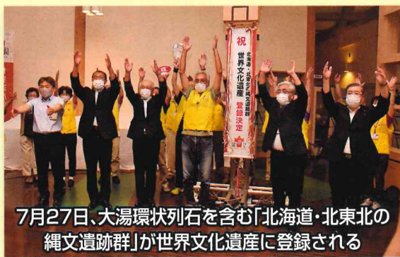
7月27日、大湯環状列石を含む「北海道・北東北の縄文遺跡群」が世界文化遺産に登録される