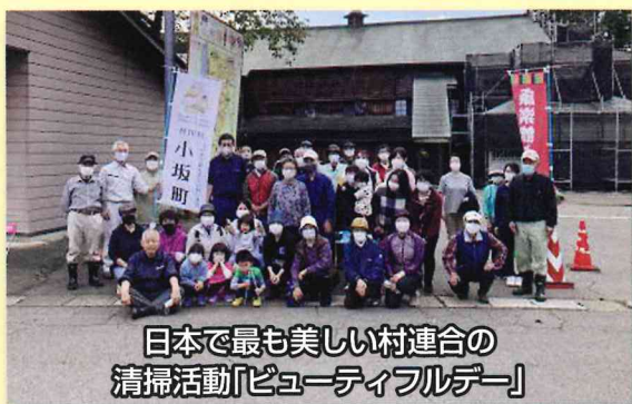
日本で最も美しい村連合の 清掃活動「ビューティフルデー」