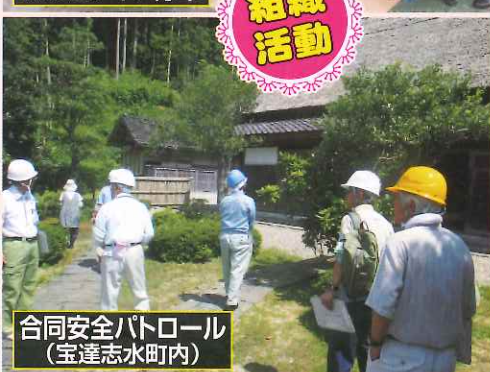
合同安全パトロール (宝達志水町内)