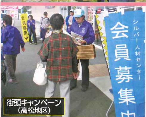
街頭キャンペーン (高松地区)