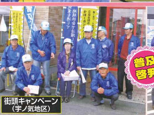
街頭キャンペーン (宇ノ気地区)