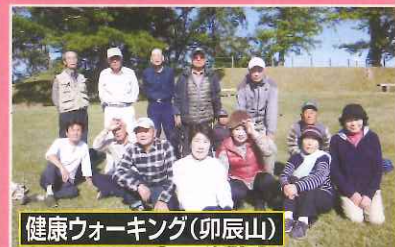
健康ウォーキング(卯辰山)