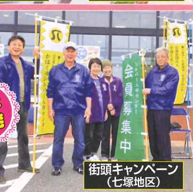
街頭キャンペーン (七塚地区)