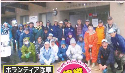
ボランティア除草