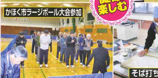
かほく市ラージボール大会参加