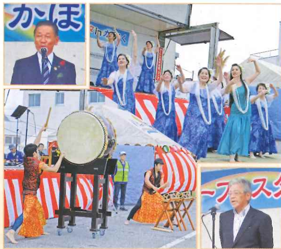
シルバーフェスタinかほく会場の様子

方改革が検討されています。当センターにおいては、シルバーの方々体力・能力に応じて、人生経験や技能を生かし、臨時的かつ短期的または軽易な就業を通じて、生きがいを得ると共に地域の活性化につながることを目的として就業機会を確保していきたいと考えています。本年も皆様のご支援を賜りますよう、よろしくお願い申し上げます。