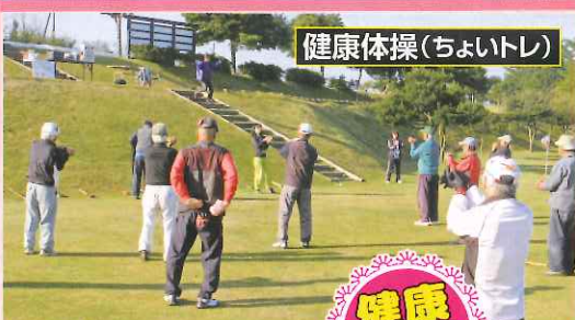
健康体操(ちよいトレ)