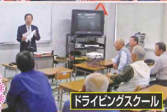
ドライビングスクール