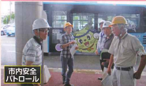
市内安全 パトロール