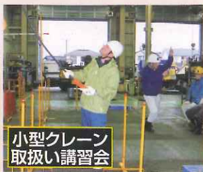
小型クレーン 取扱い講習会