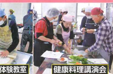
そば打ち体験教室