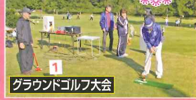
グラウンドゴルフ大会