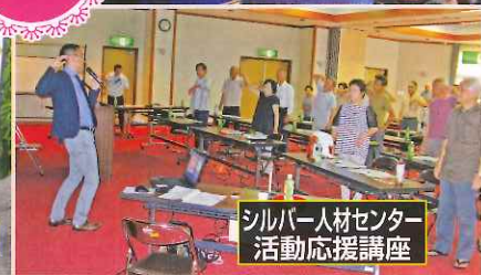
シルバー人材センター 活動応援講座