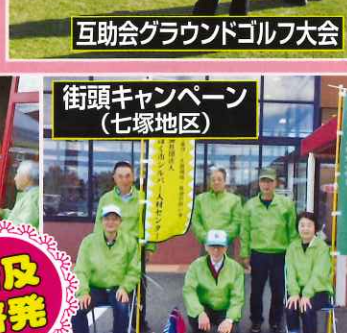
街頭キャンペーン (七塚地区)