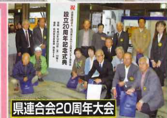
県連合会20周年大会