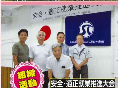
安全・適正就業推進大会