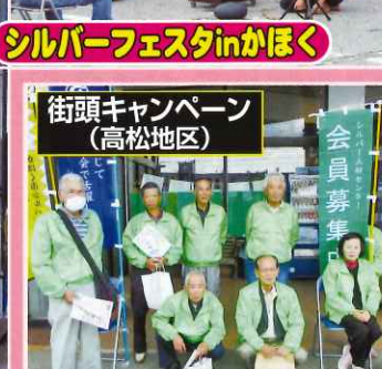
街頭キャンペーン (高松地区)