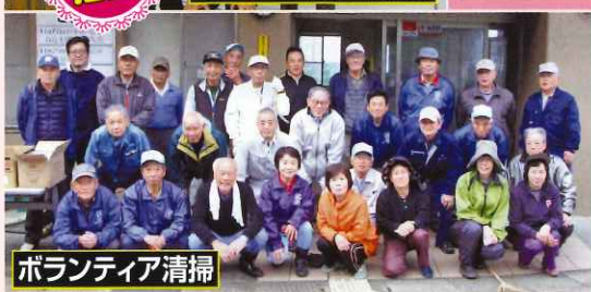
ボランティア清掃