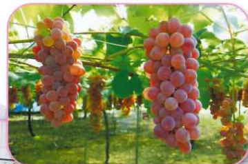
▼ぶどう畑で色付き始めたデラウェア

地域のニーズに対応し、遊休地を活用したぶどう、さつまいもの栽培事業に取り組みました。栽培に関する講習会、実習を重ね、またぶどう狩りの体験等を行い、大きな成果を得ました。