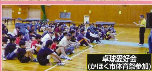
卓球愛好会 (かほく市体育祭参加)