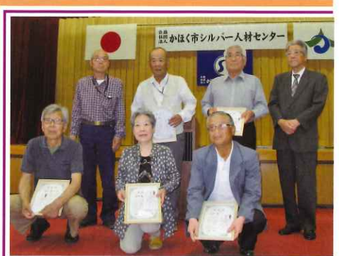
▲会員表彰された皆様