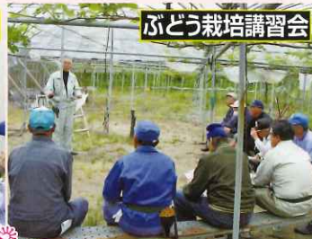
ぶどう栽培講習会