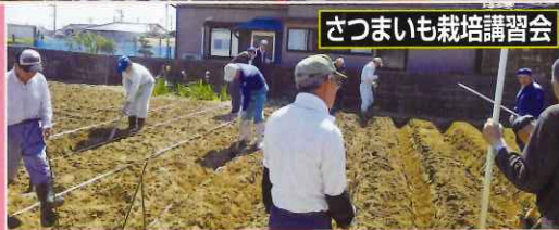
さつまいも栽培講習会