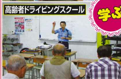
高齢者ドライビングスクール