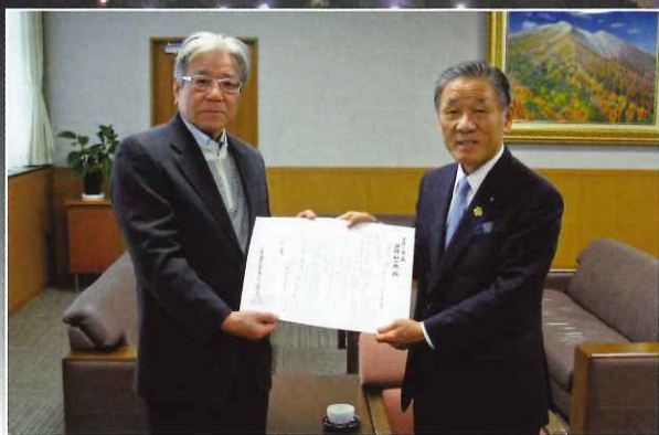
▲市長へ活動支援要請

このような状態から高齢者の方々には、意欲がある限り、なるべく長く頑張っていただき、これまで培われた経験や技能を社会の中で発揮していただくことが地域の活性化にもつながっていくのではないかと言われています。 そういった意味合いから、当センターでは、今年度新たにかほく市の施策、