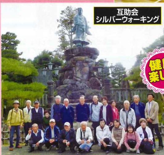
互助会 シルバーウォーキング