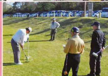
互助会グラウンドゴルフ大会