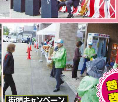
街頭キャンペーン (宇ノ気地区)