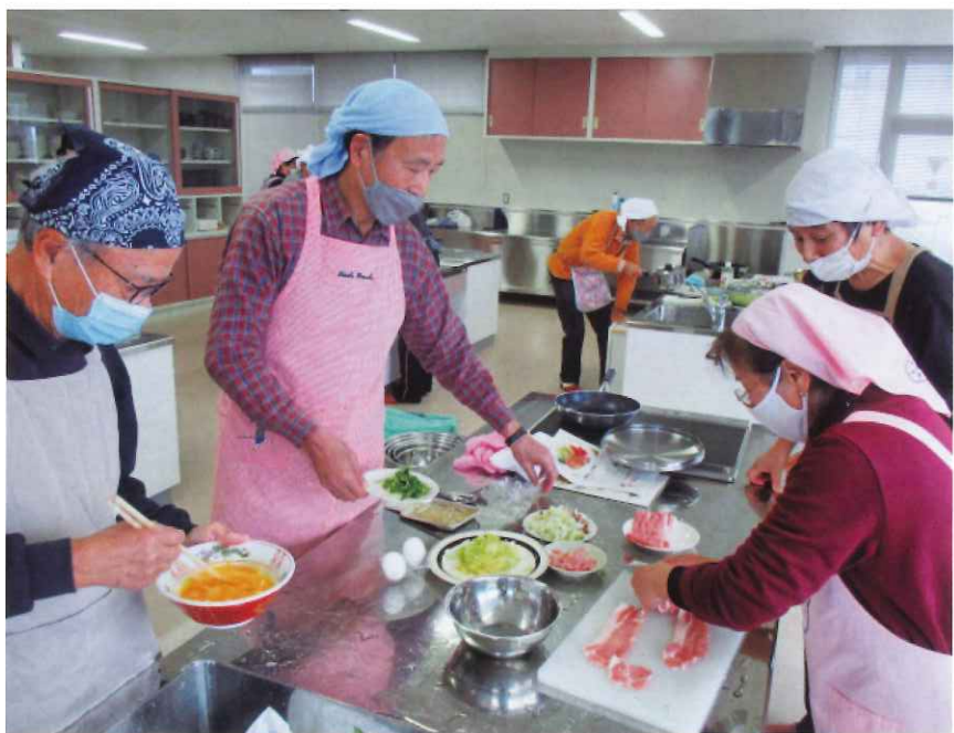
男性料理教室(12月) 高松産業文化センター