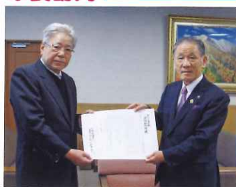
シルバー事業の支援要請