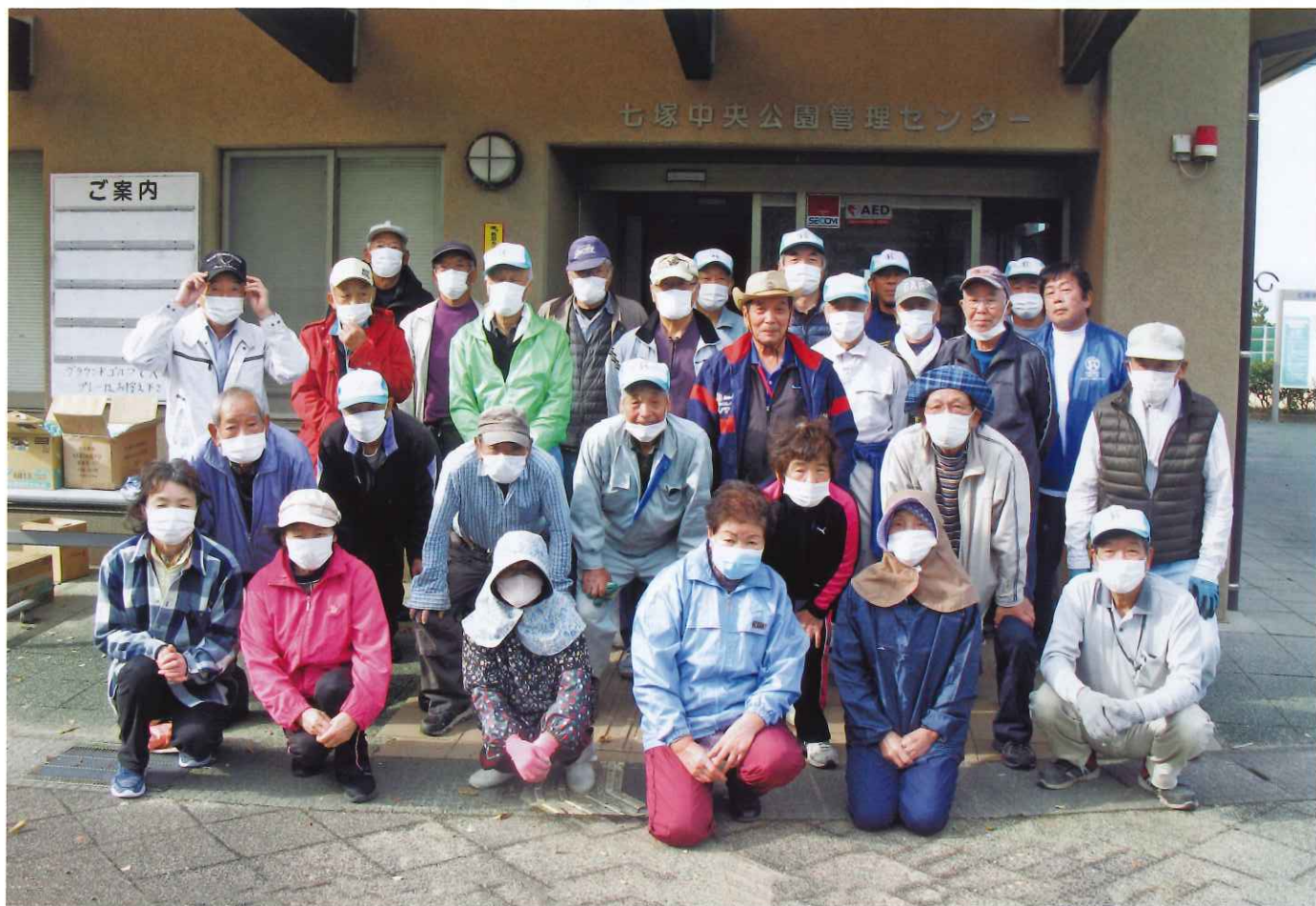
ボランティア清掃(11月) 七塚中央公園