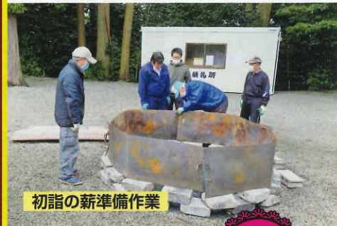
初詣の新準備作業