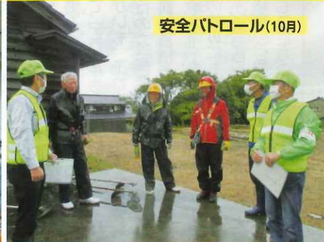
安全パトロール(10月)