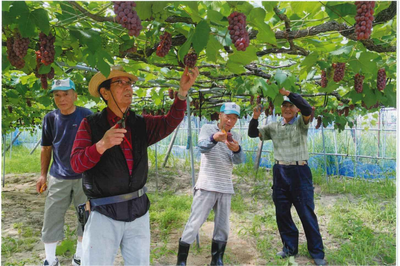
ぶどう収穫作業(7月) シルバーぶどう畑