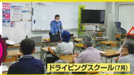
ドライビングスクール(7月)