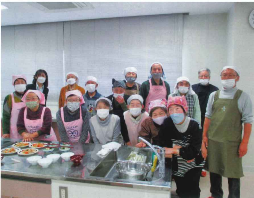
健康料理教室(12月) 高松産業文化センター