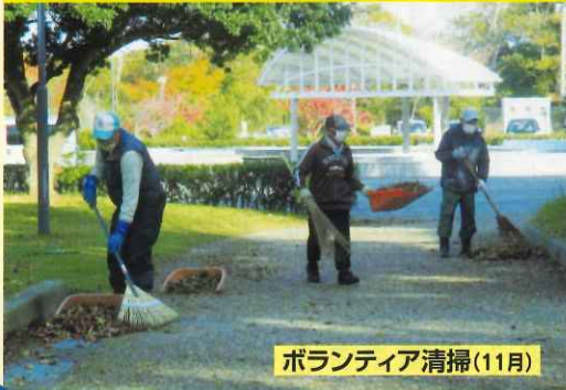
ボランティア清掃(11月)