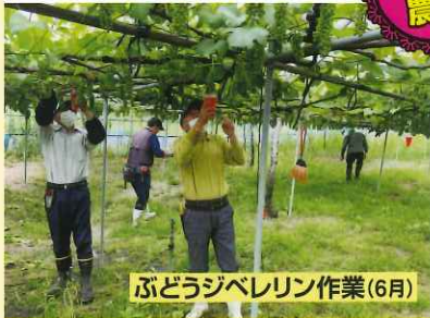
ぶどうジベレリン作業(6月)