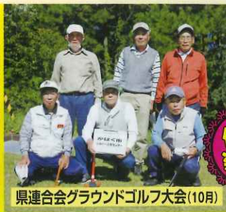
県連合会グラウンドゴルフ大会(10月)