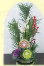
会員 近谷 正季 作