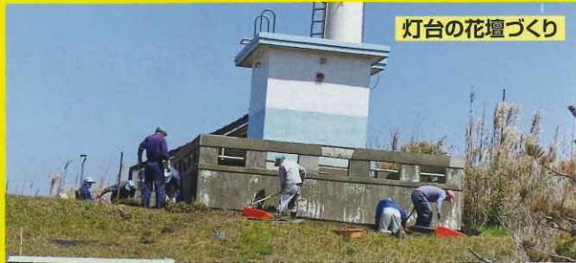
灯台の花壇づくり