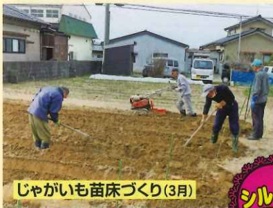
じゃがいも苗床づくり(3月)