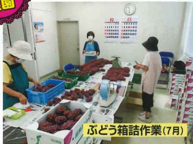
ぶどう箱詰作業(7月)