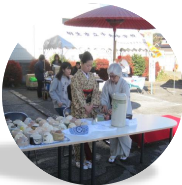
今回はお抹茶のサービスも！大好評でした♥