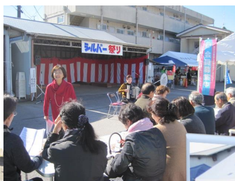
大勢の皆さんにご来場いただき、良いPRになりました！