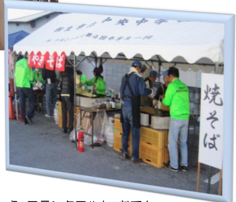
焼きそば、焼きまんじゅう、フランクフルト、おでん・・・ 会員さん、大奮闘 (=^・^=)