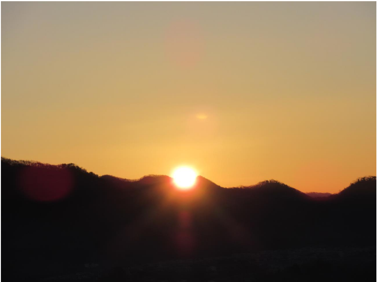
水道山山頂 初日の出