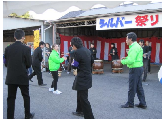
地域の皆さんと、楽しく交流ができました♪