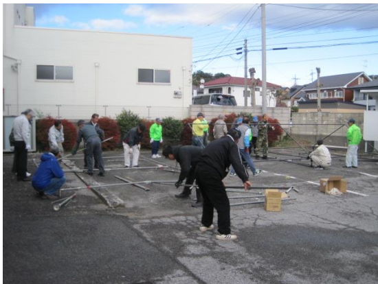
前日のテント組立、ありがとうございます。(^_^)

会員の方々が何日もかけてお手伝いくださったおかげで、有意義なシルバー祭りが出来た事は素晴らしいと思います。次回も沢山の会員の方々の出席をお願いします。