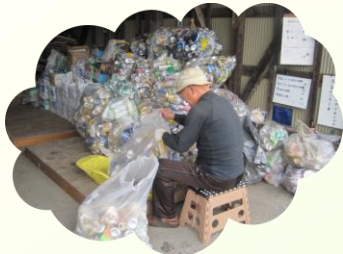
いつもありがとうございます(^^)