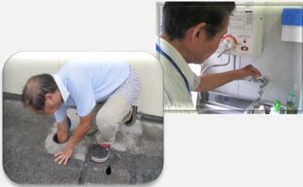
止水栓を止めてパッキン交換（練習風景）