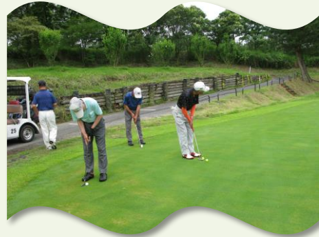
スタート前のパッティング練習 ♪/~~~~