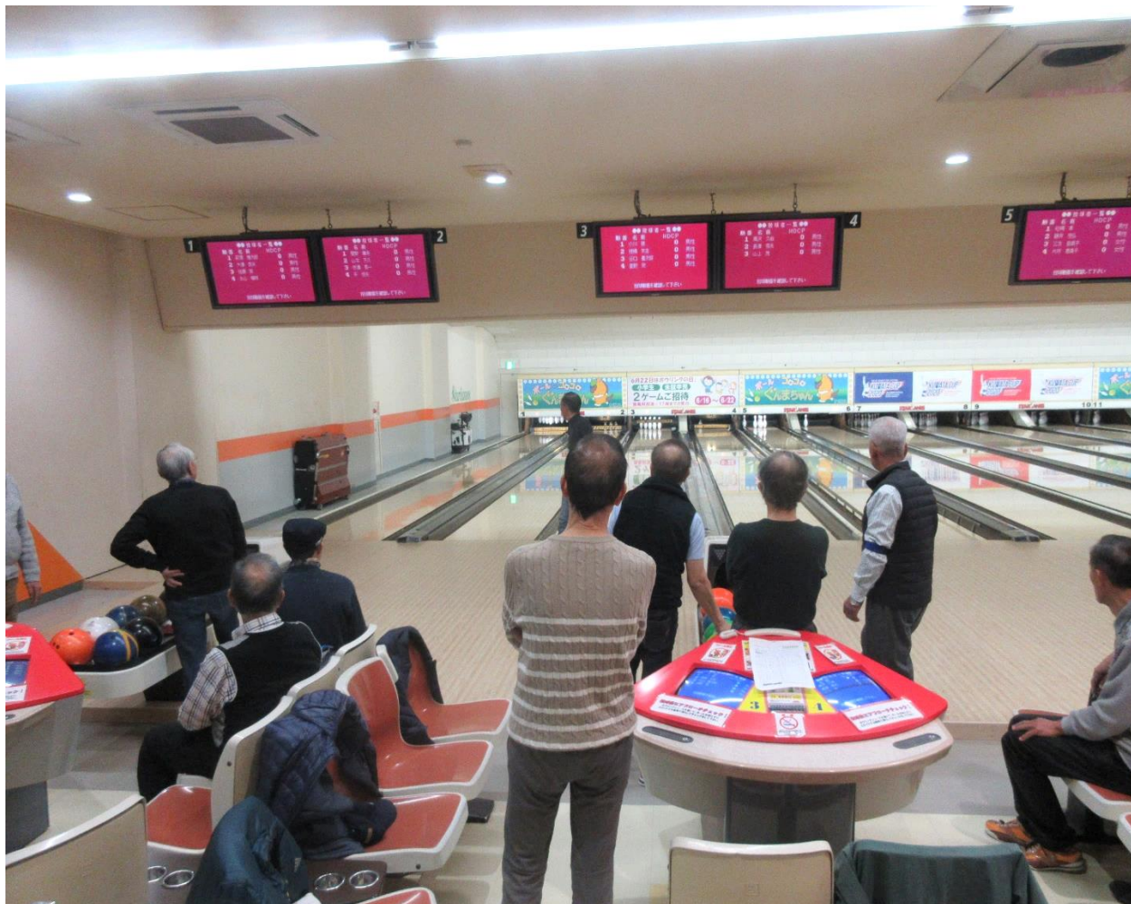
シルバーボウリング大会