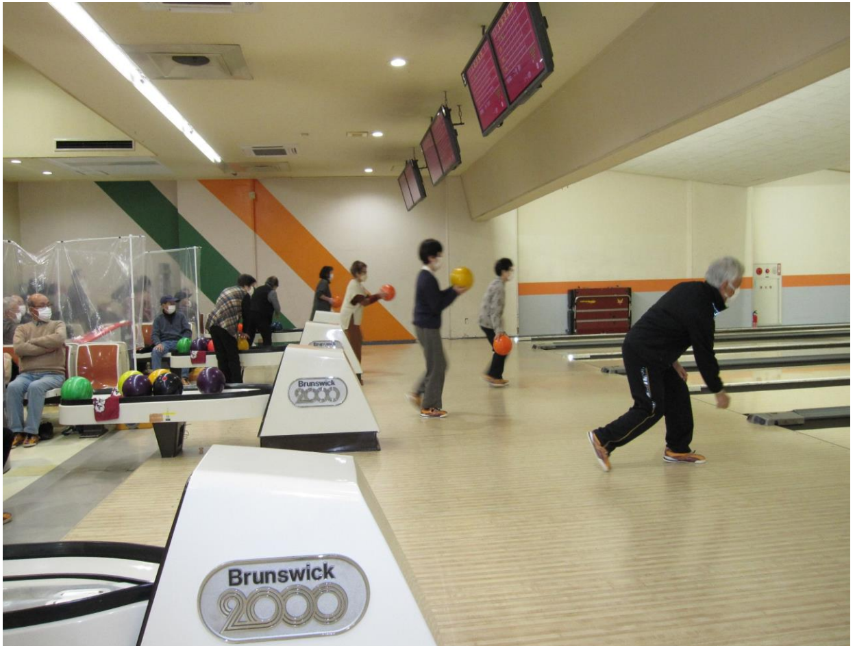
ボーリング大会（桐生スターレーン）