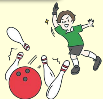
取材：周藤 美代子(広報委員)