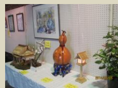
みどり市 SC の会員さんが賛助出品！