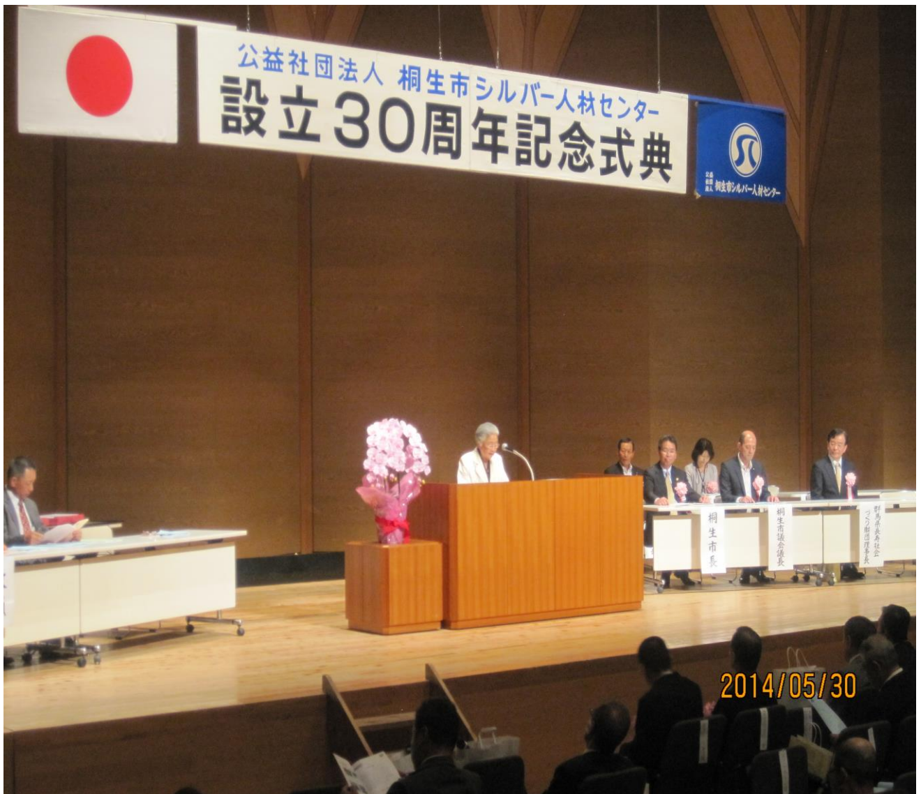
設立 30 周年記念式典 (桐生市市民文化会館小ホール)