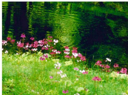
写真クラブ-“くりん草”（日光にて）