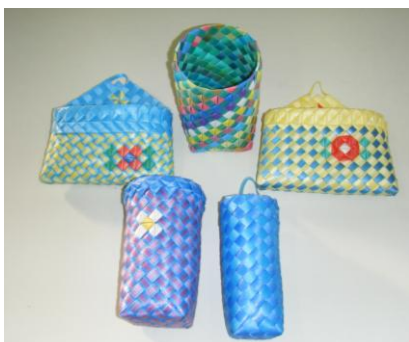
手づくりの会-PP 作品制作中！