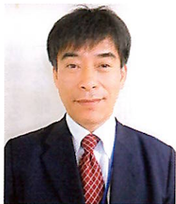
大町市民生部 福祉課長