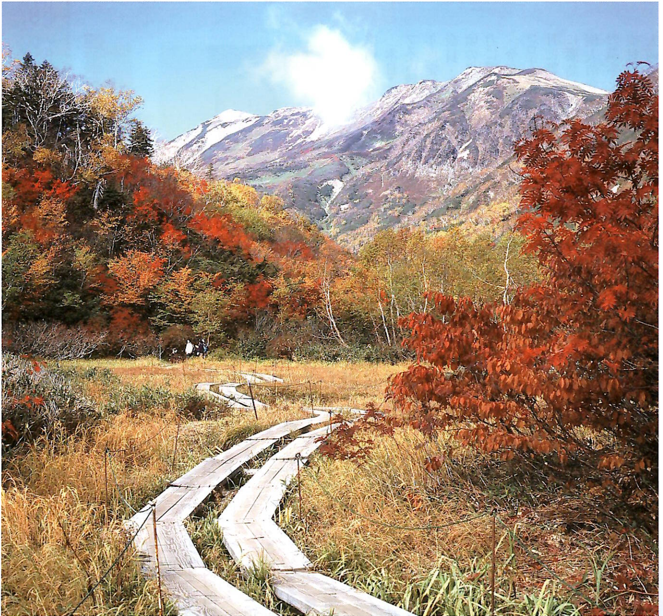
梅池自然園