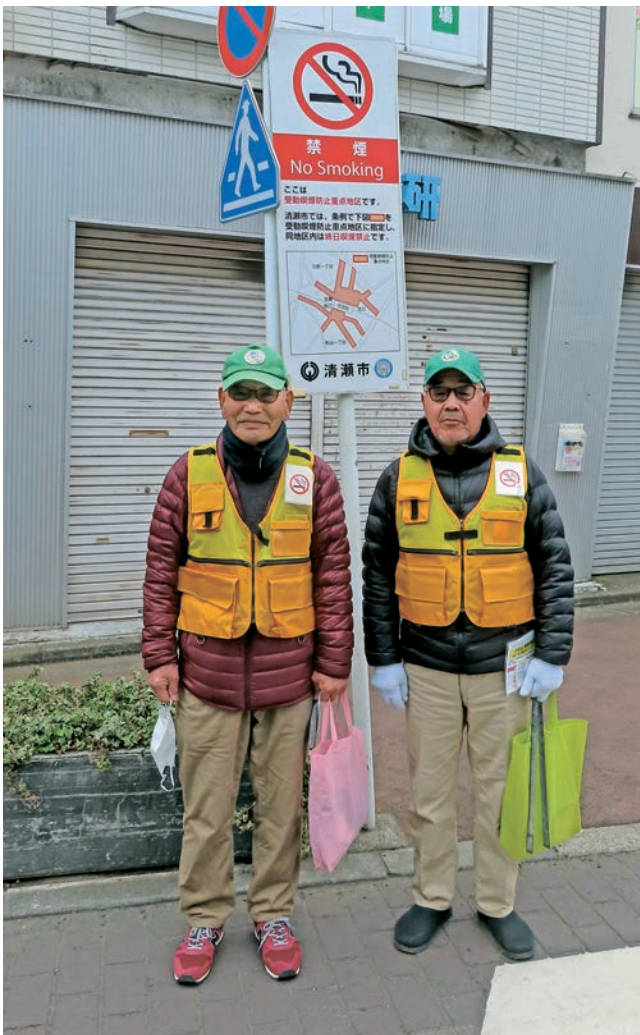
(喫煙防止指導パトロール等業務就業会員)