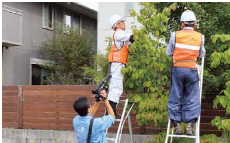
放送は奇数月第4土曜日から2週間です

シルバー人材センターの入会要件と入会方法は、本広報誌の表紙に記載のとおりです。ご確認ください。