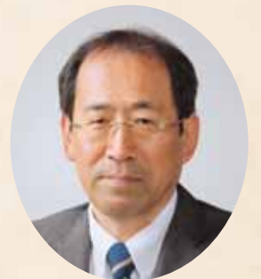
町長 成瀬 敦

結びに、会員の皆様、ご家族の皆様、そして町民の皆様のご健勝とご多幸を心からご祈念申し上げます。また、年頭のご挨拶とさせていただきます。