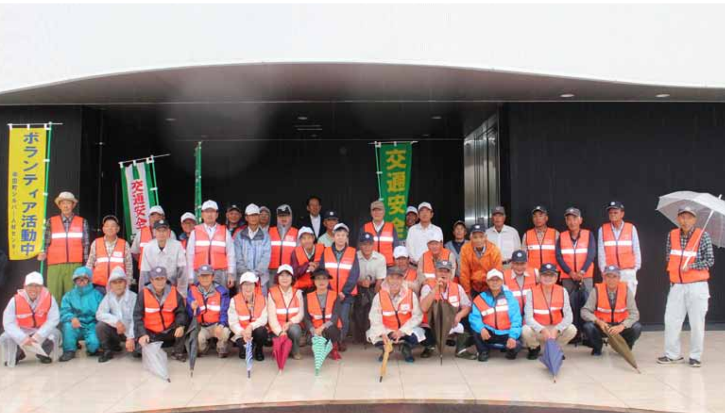
写真は交通安全街頭啓発ボランティアの参加会員