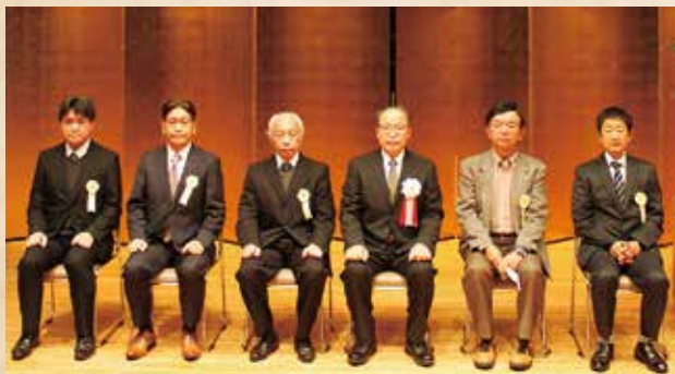
会長感謝を受けられた皆様